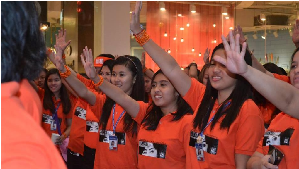
Zonta oranges the World, auch in Laguna, Philippinen.

Häusliche Gewalt, das ist eine von vielen Facetten der Gewalt an Frauen und Mädchen, die in Corona-Zeiten weltweit zunimmt. So erwarten die UN-Organisationen aufgrund der COVID-19-Pandemie weitere Millionen Fälle von Kinderheirat, weiblicher Genitalverstümmelung und ungewollter Schwangerschaft.